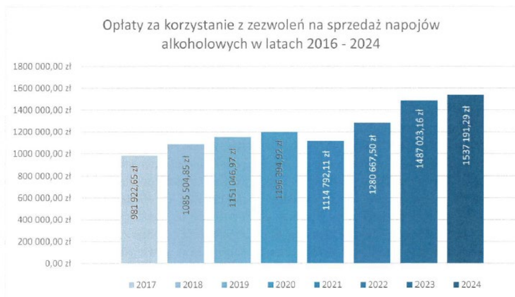
Wykres 1. Opłaty za korzystanie z zezwoleń na sprzedaż napojów alkoholowych. Źródło: Sprawozdanie z realizacji Gminnego Programu Profilaktyki i Rozwiązywania Problemów Alkoholowych oraz Przeciwdziałania Narkomanii i Uzależnieniom Behawioralnym na lata 2023-2026.

Z roku na rok rosną opłaty za korzystanie z zezwoleń na sprzedaż napojów alkoholowych, co przedstawia poniższy wykres.